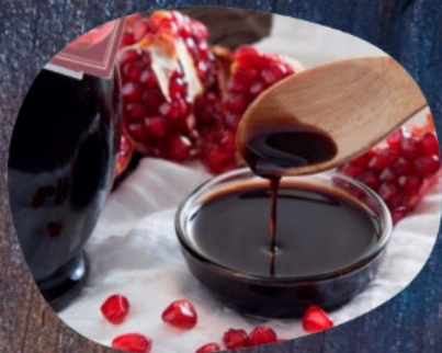
ГРАНАТОВЫЙ НАРШЕРАБ 50г