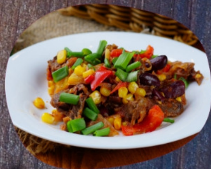
САЛАТ ТБИЛИСИ 200г.

Фасоль, перец, лук красный, грецкий орех, говядина, кинза, перец, чеснок