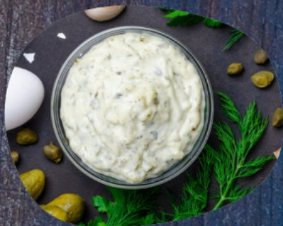
соус ТАРТАР 50г