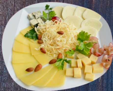
СЫРНАЯ АССОРТИ 200г.