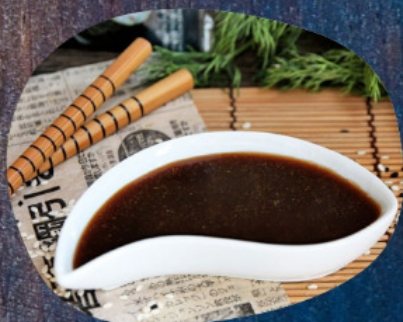
соус ТЕРИЯКИ 50г