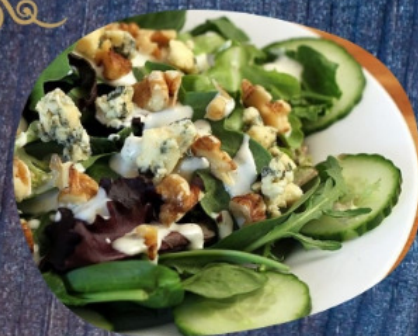
САЛАТ “МАНГАЛ” 200г.

овощи, запеченные на мангале, лук репчатый, зелень, чеснок, масло растительное