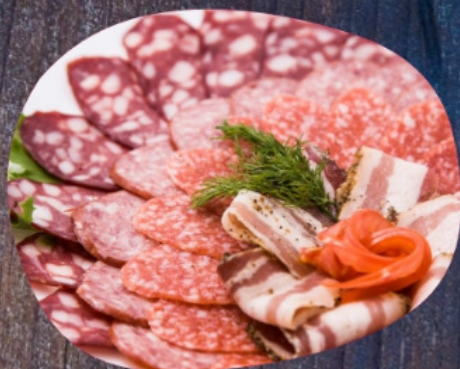
КОЛБАСНАЯ АССОРТИ 300г.