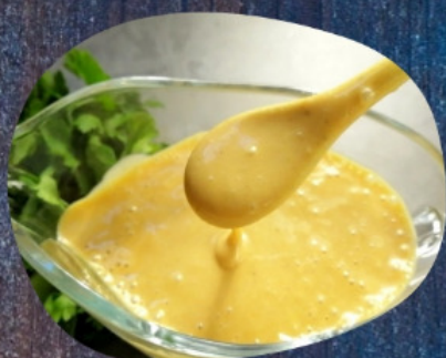
соус ГОРЧИЧНЫЙ 50г