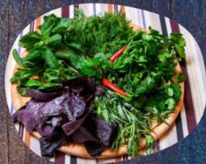
ЗЕЛЕНЬ АССОРТИ 100г.