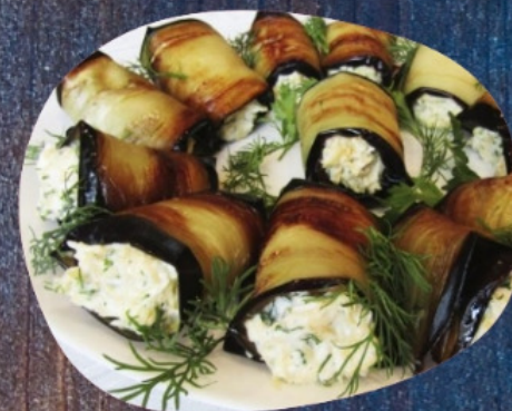
РУЛЕТКИ ИЗ БАКЛАЖАНОВ

обжаренные баклажаны, сыр, грецкий орех, чеснок, укроп, майонез