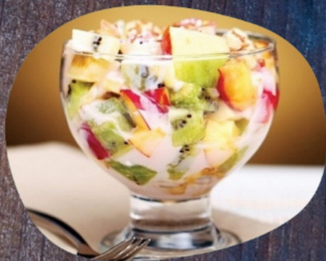
МОРОЖЕНОЕ С ФРУКТАМИ