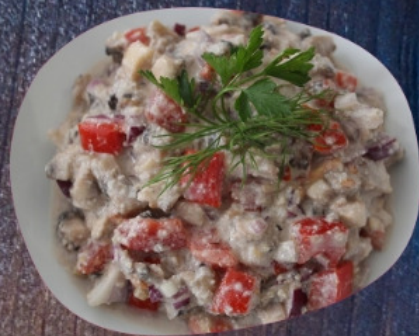
САЛАТ ГЛОРИЯ 200г.

ветчина, язык, помидоры, огурец свежий, майонез