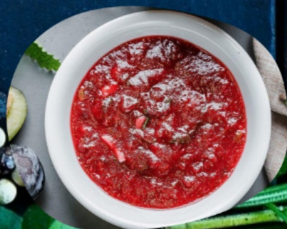
соус ТКЕМАЛИ 50г