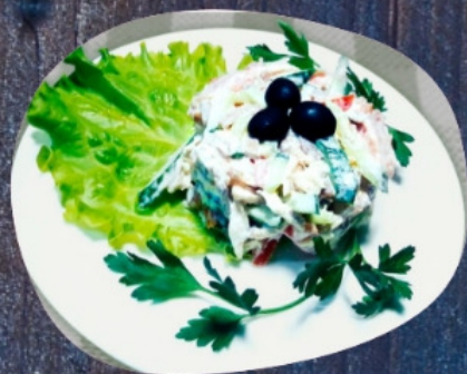
САЛАТ ИМПЕРИАЛ 200г.

язык, филе куриное, помидоры, огурцы, майонез